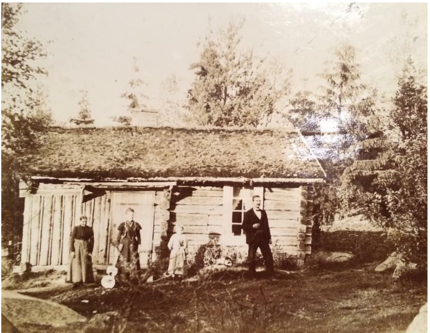
Vallbomstorpet, Stava till vänster.