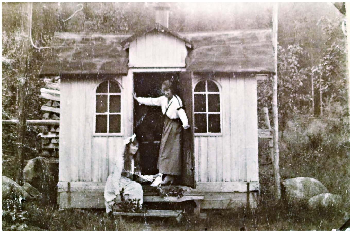
Badhuset. På platsen för badhuset står nu en skylt från Skogsvårdsstyrelsen med den felaktiga informationen "Torplämning. Vallbomstorpet"